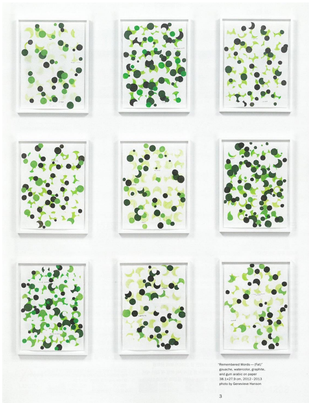
"Remembered Words — (Fat)" gouache, watercolor, graphite, and gum arabic on paper 38.1x27.9 cm, 2012–2013