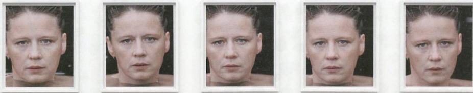
"Untitled (Weather)" inkjet/pigment print on paper: 5 color prints, mounted on sintra, 31.11×26.03cm (each) 2010-2011