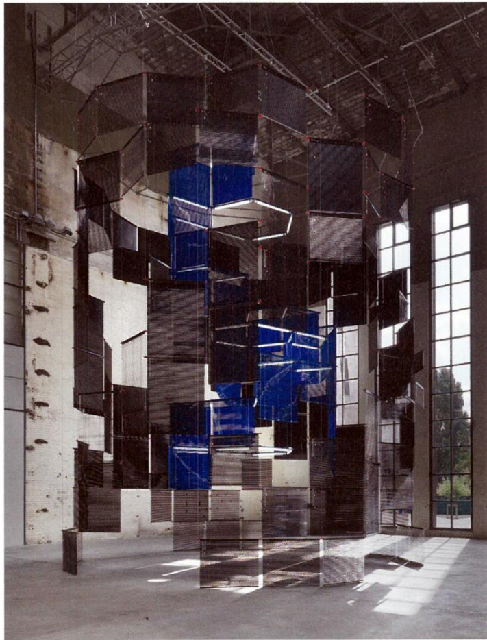
양혜규, <침묵의 저장고 - 클릭된 속심>, 2017, 건물 현대미술센터, 베를린, 독일, 2017

지난해에 이어 올해도 양혜규의 전시를 서울에서 만나볼 수 있게 되었다.(알다시피, 이제 그의 작품은 국내보다 국외에서 더욱 수월하게 만날 수 있다.) 지적이면서도 감각적인 자극을 주는 아티스트 양혜규의 신작은 언제나 궁금하다. 올여름 국립현대미술관에 전시될 신작 <소리 나는 조각의 사중주(가제)>는 작가의 오랜 관심사 중 하나인 '살림'을 주제로 한 것으로, 가정에서 사용하는 오브제를 인체에 대응하는 크기로 확장시킨 작품이다. 물리적으로 변형된 일상의 사물을 참조물로 삼아 현실에 대한 새로운 사유를 만들어내는 것은 그녀의 전매특허다. 대기의 움직임과 같은 눈에 보이지 않는 자연 현상을 가시화한 설치작품도 있다. 오랜 시간에 걸쳐 전개된 블라인드 설치 연작의 최근 단계를 보여주는 대형 블라인드 조각 <침묵의 저장고 - 클릭된 속심>도 전시된다. 끊임없이 확장되어가는 양혜규 세계의 현재 상황을 확인할 수 있는 단서들이다. 8월 29일부터 2021년 1월 17일까지 국립현대미술관 서울.