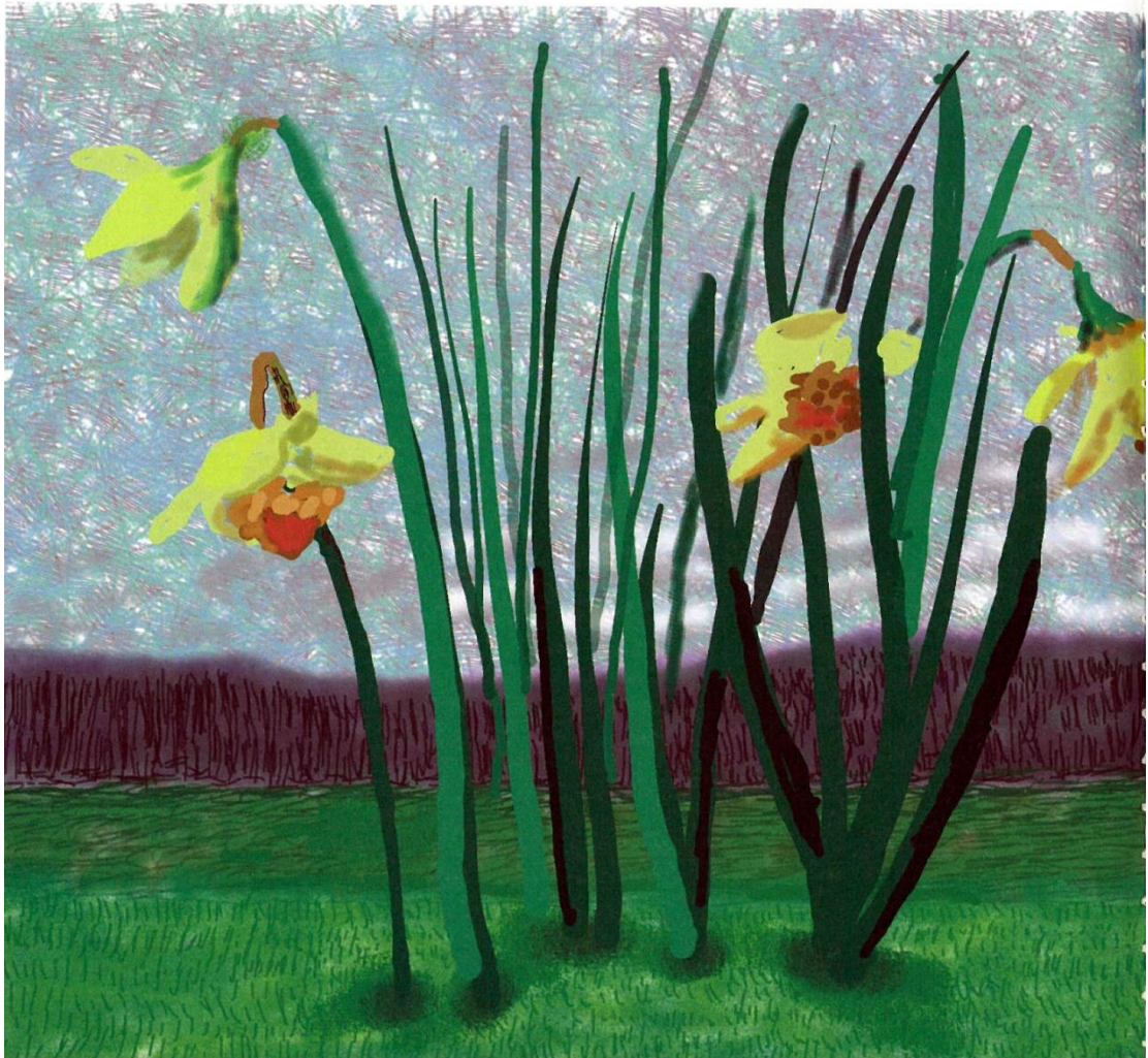
David Hockney, <Do remember they can't cancel the spring>, 2020.