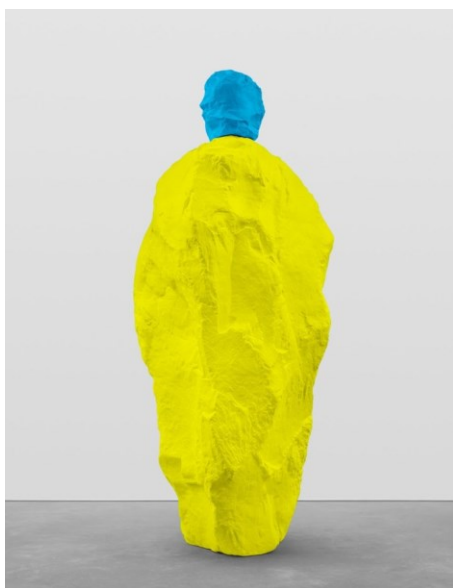
우고 론디노네(b. 1964), 'blue yellow monk', 2020, Painted Bronze, 295×125×114.5cm.