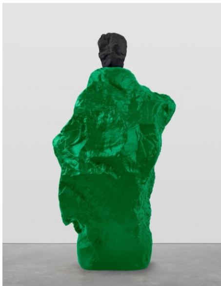
우고 론디노네(b. 1964), 'black green monk', 2020, Painted Bronze, 296.5×157×122cm.