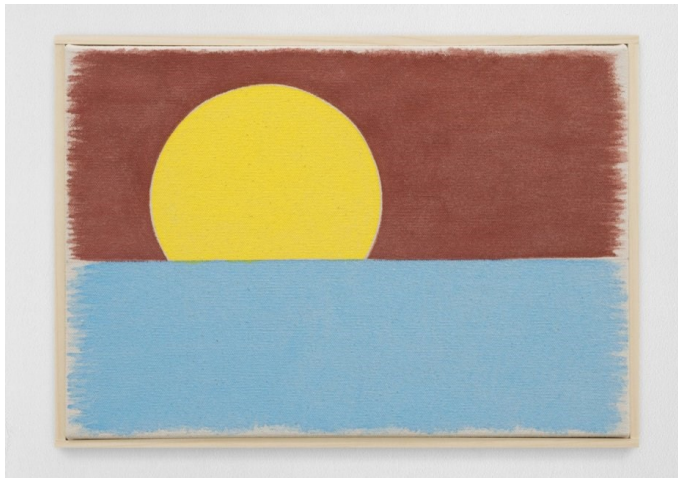
우고 론디노네(b. 1964), 'siebterfebruarzweitausendundzweiundzwanzig', 2022, Watercolor on Canvas, Artist's Frame 22.9×33cm. Courtesy of Studio Rondinone. 이미지 제공: 국제갤러리

서울점과 부산점에서 동시에 열리는 전시의 제목 'nuns and monks by the sea'의 의미는 결국 부산에서 완성됩니다. 서울을 지키는 수녀와 수도승의 존재감을, 부산에서 선보이는 해 질 녘 바다의 풍경이 품어 내죠. 하늘, 바다, 태양, 이 단출한 구성의 회화는 '매티턱(mattituck)' 연작이라고도 부릅니다. 매티턱은 작가의 스튜디오가 있는 뉴욕 롱아일랜드의 지명이에요. 창밖 풍경을 바라보던 작가는 자신에게 큰 위안을 주던 일몰 풍경을 수채화로 그려냈습니다. 그림마다 달라지는 하늘의 색과 태양의 위치는 하루하루 반복되는 시간의 기록처럼 느껴집니다. "일기를 쓰듯 살아 있는 우주를 기록합니다. 이 계절, 이 하루, 이 시간, 이러한 풀의 소리, 이렇게 부서지는 파도, 이 노을, 이러한 하루의 끝, 이 침묵." 작가 특유의 시적 언어로 직조된 수녀와 수도승, 이들을 감싼 일몰의 신비로운 풍경은 고단한 일상을 살아내는 우리를 경험과 느낌의 세계, 성찰과 명상의 순간으로 이끕니다. 이것이야말로 예술 과잉의 시대를 극복하는 미술의 힘이 아닐까요?