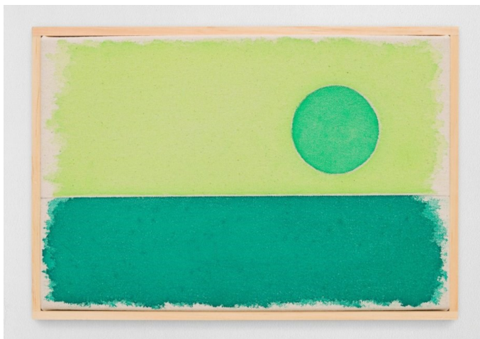
우고 론디노네(b. 1964), 'sechsterjulizweitausendundzwanzig', 2020, Watercolor on Canvas, Artist's Frame 20.3×30.5cm.