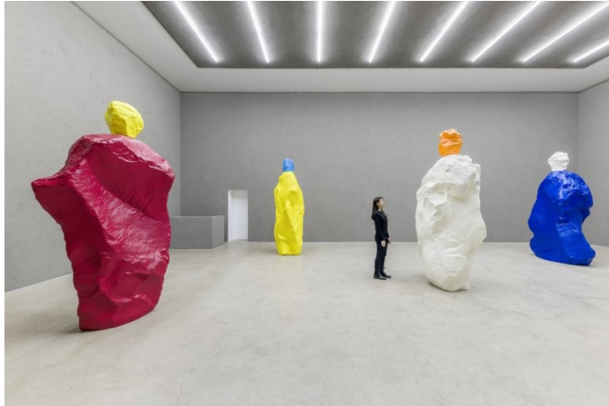
국제갤러리 서울점(K3) 우고 론디노네 개인전 <nuns and monks by the sea> 설치 전경.

실제 간밤의 꿈을 작업으로 펼쳐놓는 것처럼, 몽환적이고도 신비로운 우고 론디노네의 미술 세계. 그가 초대한 수녀와 수도승은 자연과 인간 및 인공, 꿈과 현실 등을 직관적으로 대비함으로써 합리성에 대항하는 인간의 정신성을 강조합니다. '수녀와 수도승'이라고 칭하긴 했지만, 이는 딱히 특정 종교에 관한 작품은 아닙니다. "인간의 내적 자아와 자연의 세계를 다루고자 한다"는 작가의 말처럼, 이들은 깊은 내면으로 진입하도록 도울 뿐입니다. 색색깔의 조각을 눈으로, 물리적으로 본다는 것, 이 돌덩어리처럼 생긴 수녀와 수도승을 형이상학적으로 보고 느낀다는 것에 대한 이야기를, 관념적인 동시에 시각적으로 펼쳐놓았다고나 할까요. 작품을 직관적으로 감각하는 동시에 이를 통해 현대적인 숭고미란 무엇인지 질문하고 사유하게 합니다.