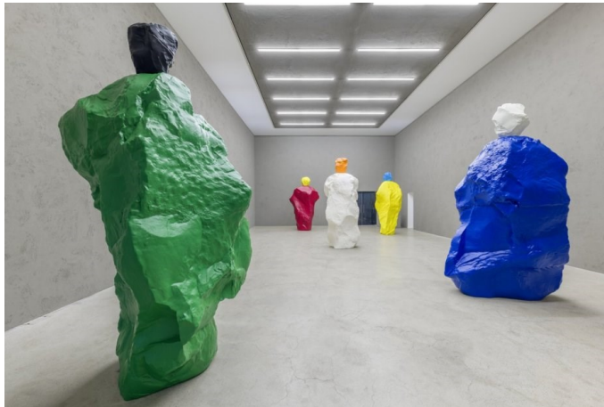
국제갤러리 서울점(K3) 우고 론디노네 개인전 <nuns and monks by the sea> 설치 전경.

우고 론디노네가 만든 인공적이고 또 자연적인, 가장 신비로운 풍경. 개인전 <nuns and monks by the sea(바다의 수녀와 수도승)>.