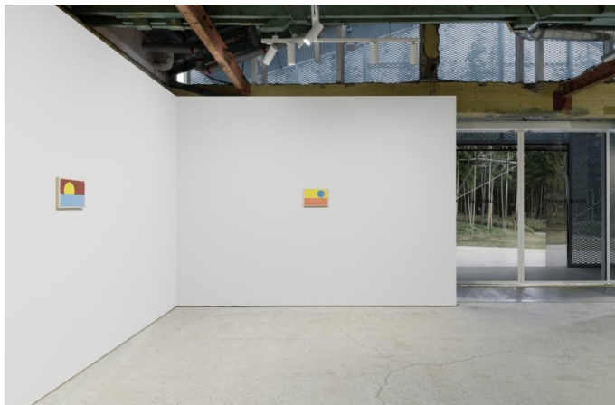
국제갤러리 부산점 우고 론디노네 개인전 <nuns and monks by the sea> 설치 전경.