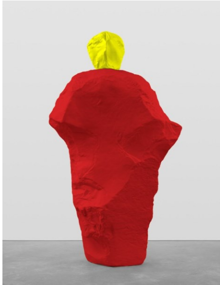
우고 론디노네(b. 1964), 'yellow red monk', 2020, Painted Bronze, 295×170.5×97cm.