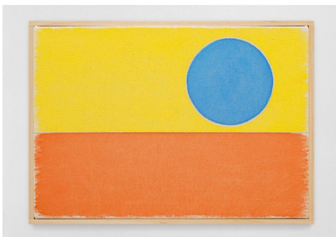
우고 론디노네(b. 1964), 'neunzehnterfebruarzweitausendundzweiundzwanzig', 2022, Watercolor on Canvas, Artist's Frame 22.9×33cm.