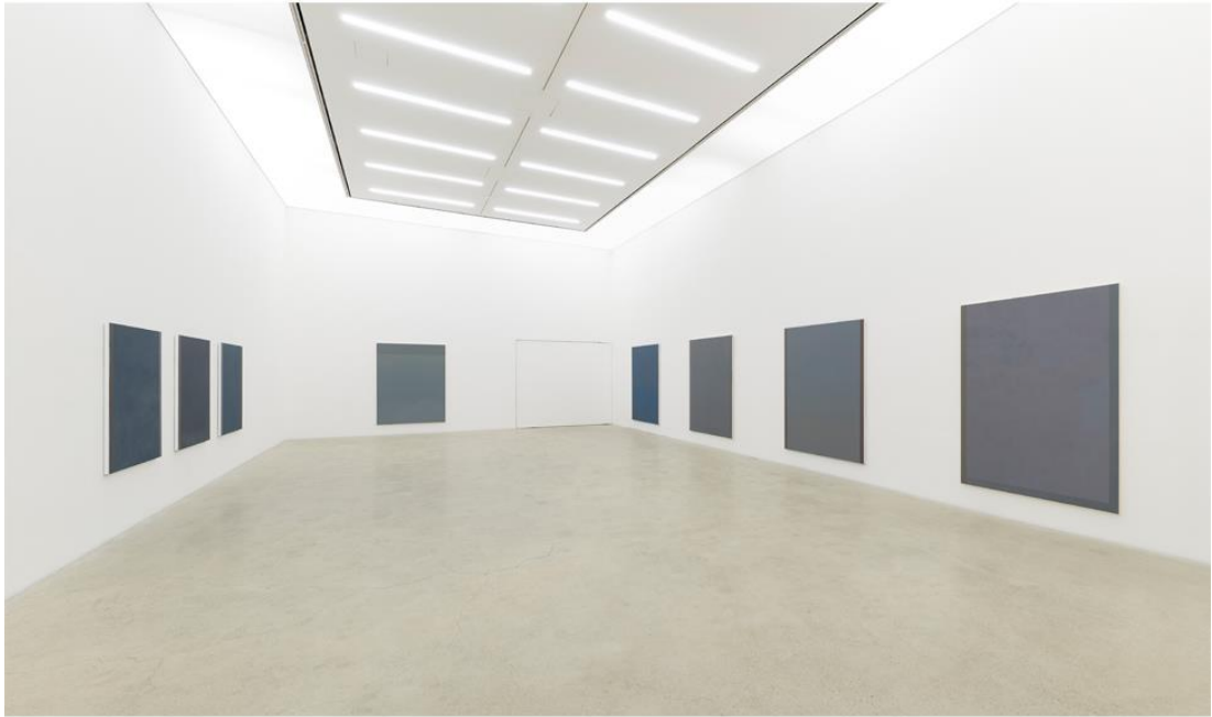
국제갤러리 3관 (K3) 바이런 김 개인전 <Sky> 설치 전경

무수히 많은 별들이 반짝이는 시골의 밤하늘과 대조되는 도시의 밤하늘 풍경은 제한적이며 우리에게 친숙하다. 이 연작은 친밀감을 반영하듯이 작가가 홀로 도시의 밤을 거닐며 떠올린 지인 혹은 가족의 이름을 작품 제목에 담았다.