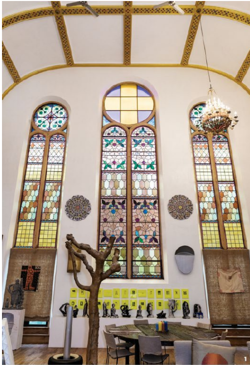
1 1887년에 지어진 유서 깊은 건축물인 할렘의 오래된 교회는 뉴욕에서 가장 아름다운 스투디오로 변모했다. 2 우고 룬디노네는 세계적인 디지털미술가인 동시에 일러레이터 전시기획자도 망상이 높다.