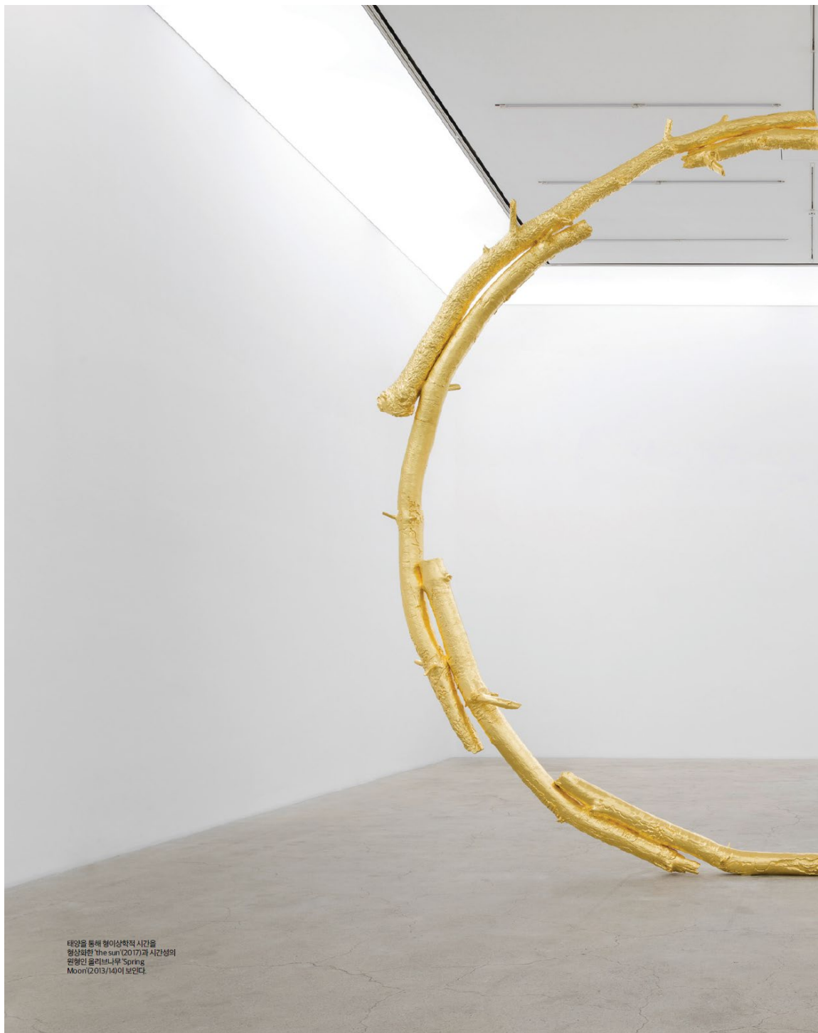
태양을 통해 형이상학적 시간을 형상화한 'the sun' (2017)과 시간성의 원형인 올리브나무 'Spring Moon' (2013/14)이 보인다.