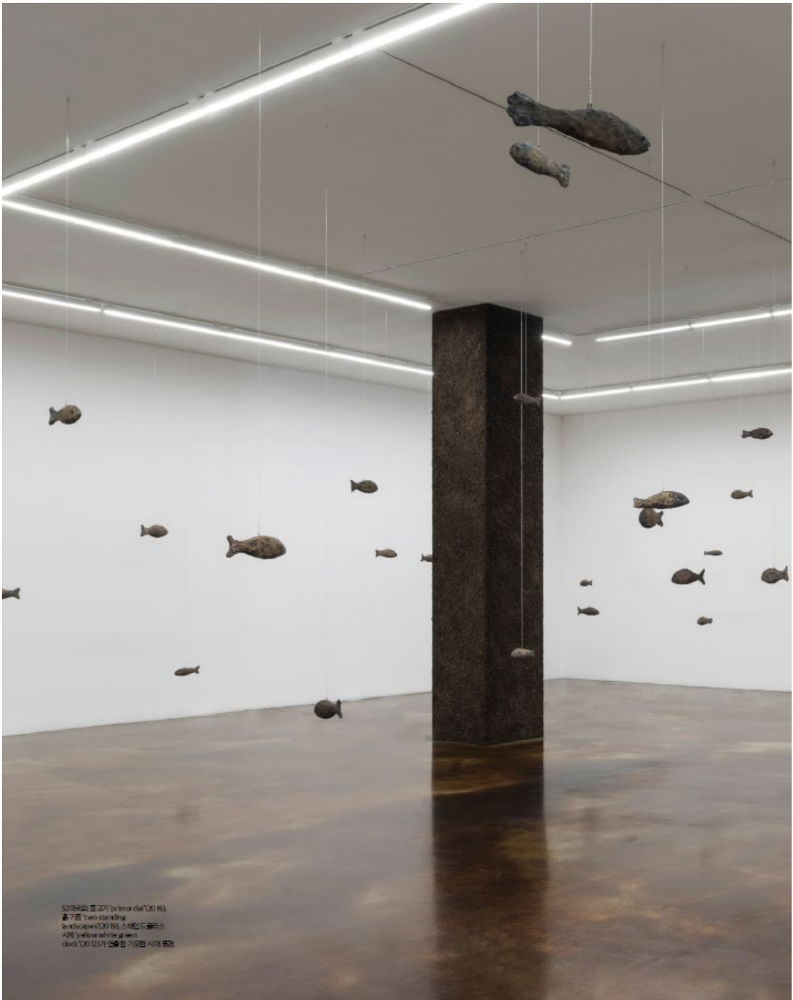
53마리의 물고기 (primordial '00 16), 魚之器 Two standing In landscapes '00 16), 스텝 5 물라스 시계 'yafkow will be at sea' clock '00 12가 연해는 기묘한 시계 풍경