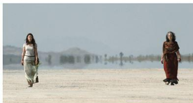
The Encounter, 2012 비디오/사운드 설치

2015년 3월 5일~2015년 5월 3일 국제갤러리 2관 & 3관 www.kukjegallery.com