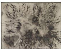
Work O 92, 1966 캔버스에 유채 115.5×145.5 cm