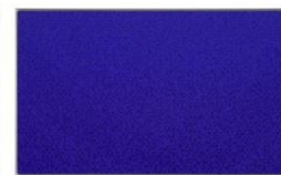
Untitled 96-12-5, 1996 캔버스에 아크릴 150×250 cm