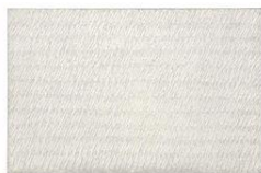
묘법 No. 89-79-82-83, 1983 마포에 유화물감, 연필 194.5×300 cm