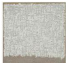
접합 95-026, 1995 마포에 유채 185x185 cm