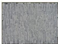
접합 04-3, 2004 마포에 유채 194x260 cm