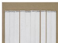
접합 15-04, 2015 마포에 유채 194x259 cm