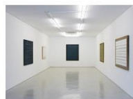
Ha Chong-Hyun Installation View K1... 가변크기