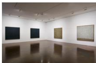
Ha Chong-Hyun Installation View K... 가변크기