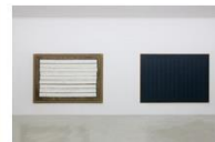
Ha Chong-Hyun Installation View K... 가변크기