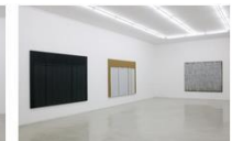
Ha Chong-Hyun Installation View K... 가변크기