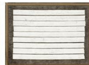
접합 15-201, 2015 마포에 유채 194x260 cm