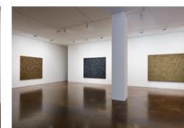
Ha Chong-Hyun Installation View K2, 2... 가변크기