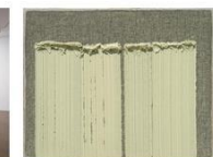
접합 14-5, 2014 마포에 유채 73x92 cm