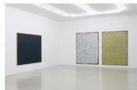
Ha Chong-Hyun Installation View K... 가변크기