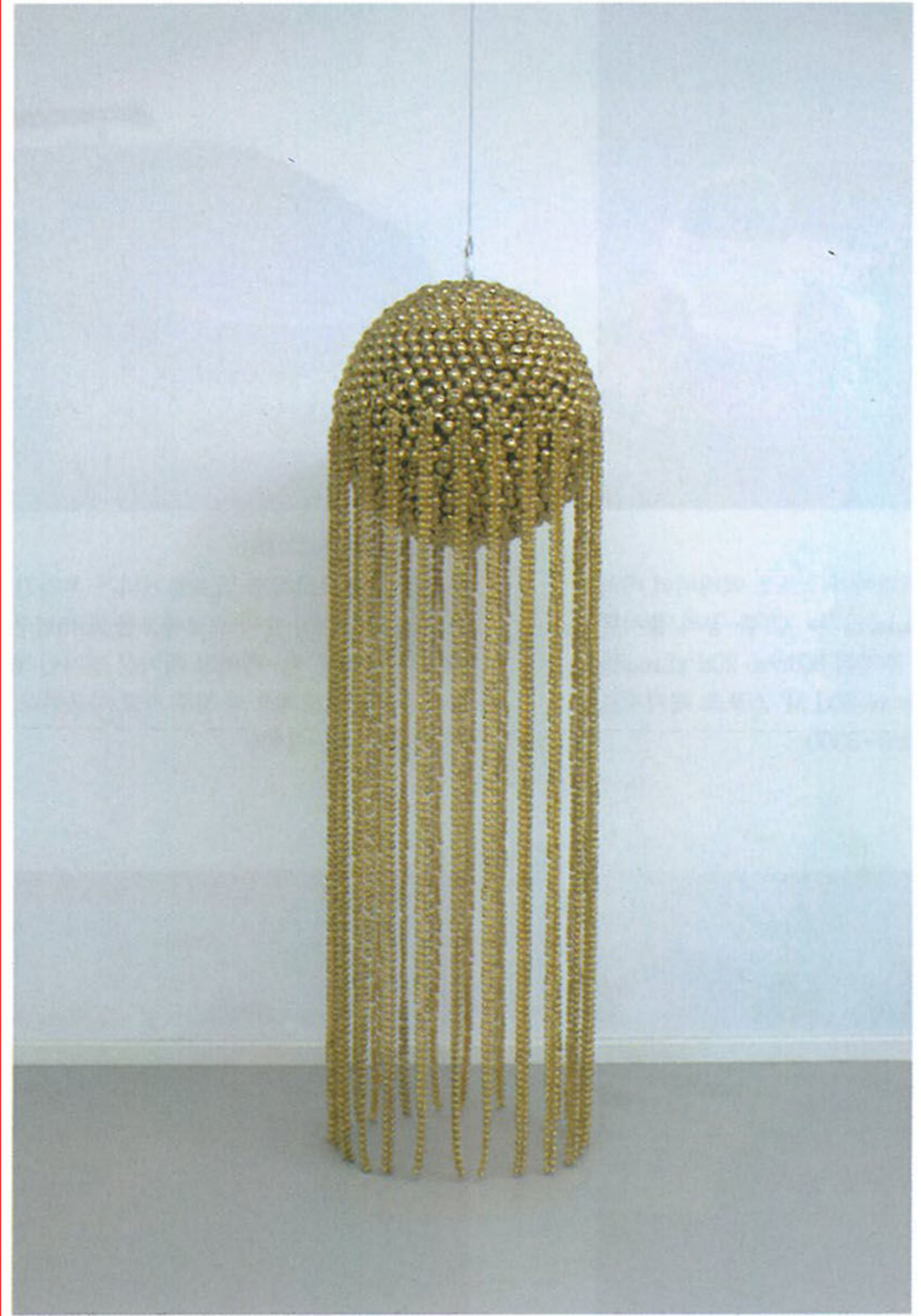
양혜규, <소리 나는 보름달 - 중량 중형 #2 (Sonic Full Moon - Medium Regular #2)>, 2014