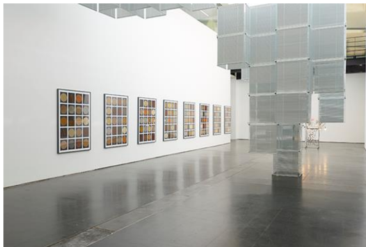
▲ 香辛月（左）2013；索尔·勒维特反转-K123456,扩大 1078 次,增倍与镜像（右）2015

《香辛月》（2013）是艺术家做驻地艺术家时的作品，8块香料制作的装框画板，将新加坡多元性和殖民地历史的气味整合到展场之中通过视觉和标题文字，这两个系列作品提示出月亮和太阳两个天体与人类知觉之间的联系。