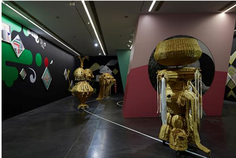
▲ 稻草雕塑 中间类型 金字塔图腾上的三球体；单足狮子舞；三足篮图腾 2015