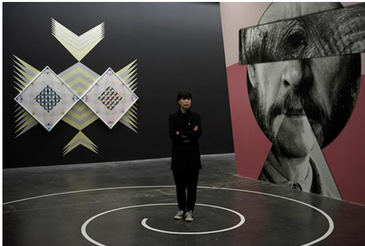
▲ 艺术家梁惠圭近照

梁慧圭（1971年生于首尔）生活和 works 于首尔及欧洲（1994年至今）。通过装置、轻型雕塑、稻草雕塑、图像、纸拼贴、墙纸以及录像文学中抽象而复杂的视觉语言，她运用不同的材料（从工业制品到手工艺）诠释她对特定故事的主观反映。梁慧圭曾于第53届威尼斯双年展（2009年）中代表韩国参展，并参加卡塞尔文献展（第13届，2012年）。她的近期展览举行于慕尼黑艺术之家（2012年）、斯特拉斯堡当代艺术博物馆（2013年）、卑尔根艺术厅（2013年）和首尔三星美术馆（2015年）。