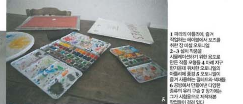
1 파리의 아틀리에, 즐겨 작업하는 테이블에서 포즈를 취한 장 미셸 오토니엘 2-3 설치 작품을 시뮬레이션하기 위한 용도로 만든 작품 모형들 4 미래 지구 인간문대 위치한 오토니엘의 아틀리에 풍경 5 오토니엘이 즐겨 사용하는 팔레트와 색채들 6 공방에서 만들어진 다양한 종류의 유리 구슬 7 창가에는 그가 시용으로 제작해본 작업들이 걸려 있다