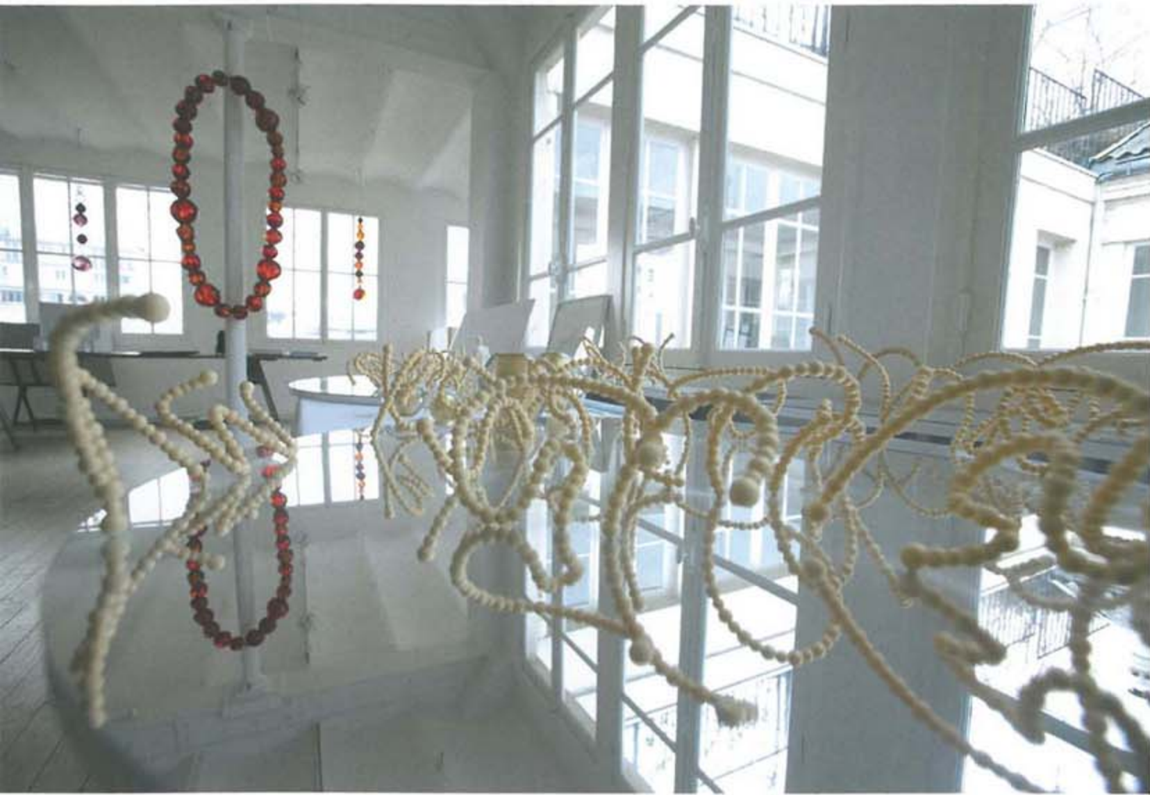
베르사유 분수대에 설치될 곡선미가 돋보이는 모형

답게 그들만의 유대와 결속이 굉장히 강하다. 아무나 작업장에 들어주지 않을뿐더러 주문도 잘 받아주지 않는다. 그들의 신뢰를 얻는 데만 2년이 넘는 시간이 걸렸다.