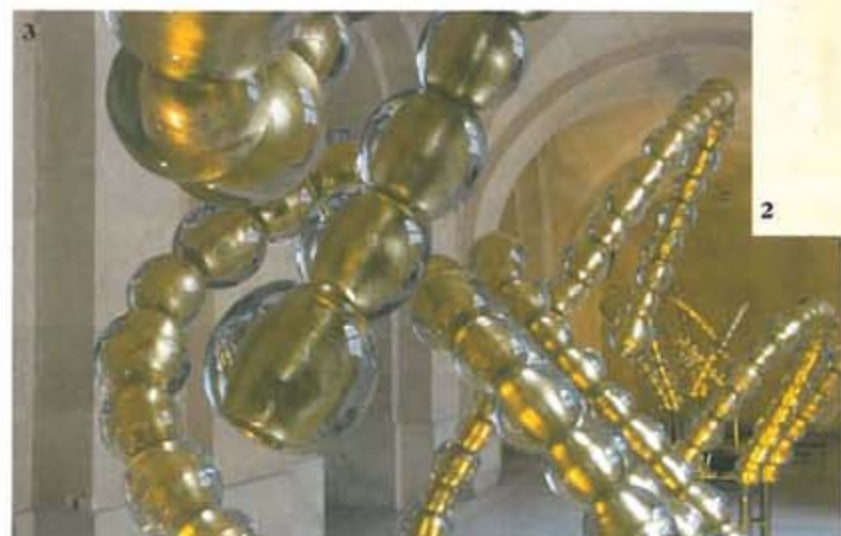
1 베르사유 궁전에서 포즈를 취한 루이 비네시와 장 미셸 오토니엘 2 라울 오제 피아에가 루이 14세의 춤을 형상화해 표현한 책 내용 3 베르사유 궁전의 정원 분수에 설치될 작품의 일부