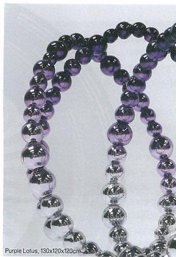
Purple Lotus, 130x120x120cm

2월 2일~3월 27일 서울 삼청동 국제갤러리, 문의 02-3210-9885