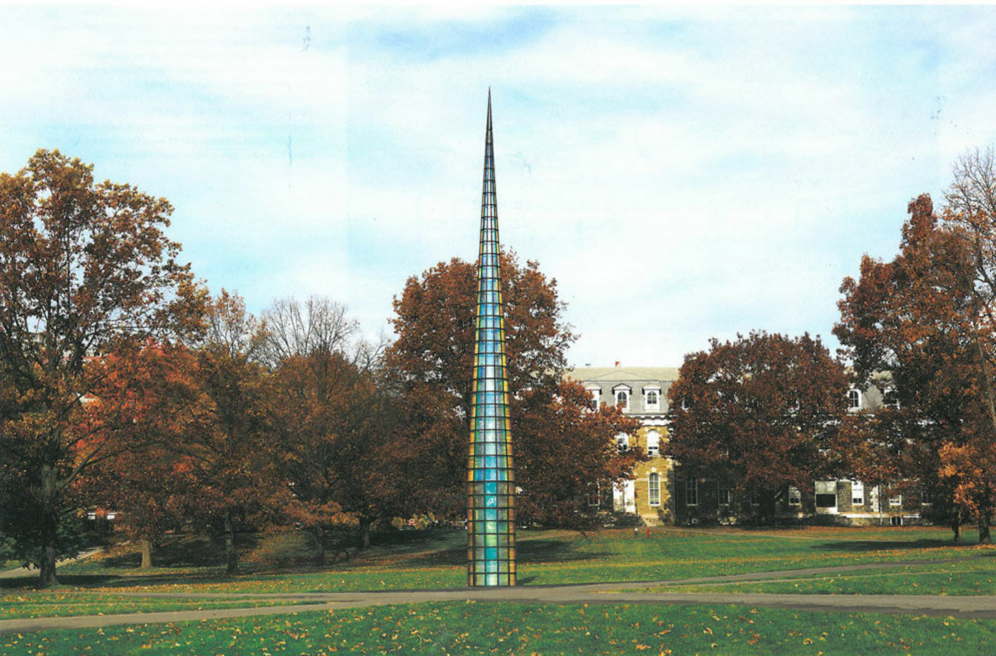
A Needle Woman: Galaxy was a Memory, Earth is a Souvenir , Steel, custom acrylic panel, laminated polymer film, mirror, 14m [height] × 1.3m [diameter], 2014