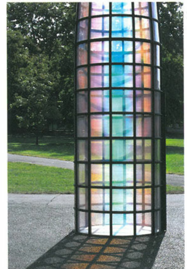
Under a raking light, each of the panels transforms the entire pavilion into a radiant spectrum of colour.

해를 상징한다. 이는 탄생과 완성의 은유로써 태양의 신 '라(Ra)'와 밀접한 관계를 가진다. 이러한 역사적 관점에서 인간은 바늘의 형태를 통해 그와 우주를 잇는 매개로서의 빛과 시간을 드러내 왔다고 할 수 있다. 결과적으로 김수자의 바늘이 갖는 시각적 현상은 나노물질이나 건축구조, 또는 예술적 의도를 통해서 구현되기보다는 미묘한 빛의 변화에서 인지할 수 있는 끊임없는 천체의 운동 안에서 이루어진다. 파빌리온의 표면을 감싸고 있는 분자구조는 물리적으로 빛을 굴절시켜 가시적인 과정으로 만들어진 또 다른 표면을 만들고 우리가 그것을 응시할 수 있도록 한다. 이런 현상은 김수자의 퍼포먼스 비디오 작품에서 보다시피 서 있는 작가의 모습과 그를 바라보는 관객 사이의 상호작용과도 구조적으로 유사하다. 또한 '바늘'은 대지와 수직적인 관계와 달리 우리 몸과는 평행한 대상으로 마주하게 된다. 캔버스 표면의 붓질로 이루어졌던 의식의 흐름은 오랜 기간 김수자의 작업에서 개념화되어 왔다. 붓에서 바늘로, 바늘은 몸으로, 몸은 시선으로. 결국 빛의 공간으로서의 시선만 남을 뿐이다. 이로써 우리의 시선은 거리와, 시간, 물질, 그리고 천체에 내재한 기억을 잇는 하나의 바느질 행위로 전환된다. 바늘 끝이 닿는 찰나와 영원의 교차점을 끊임없이 오가며.