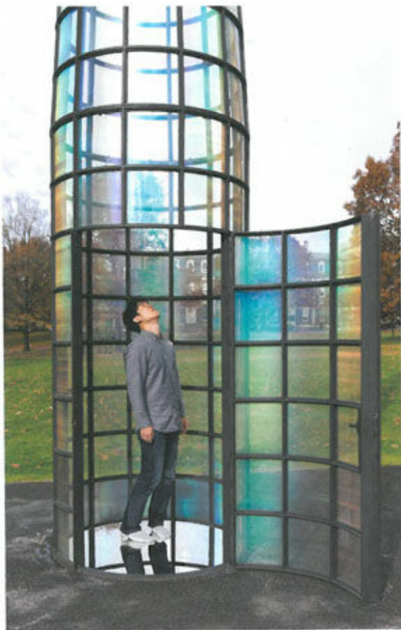
The interior of the floor is mirrored, doubling and extending the sky into the ground.