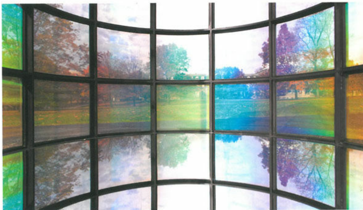
This project is infinitely dividing and redefining space almost to the point of eliminating interiority.

Her most recent work, similarly titled, A Needle Woman: Galaxy was a Memory, Earth is a Souvenir , carries this experience