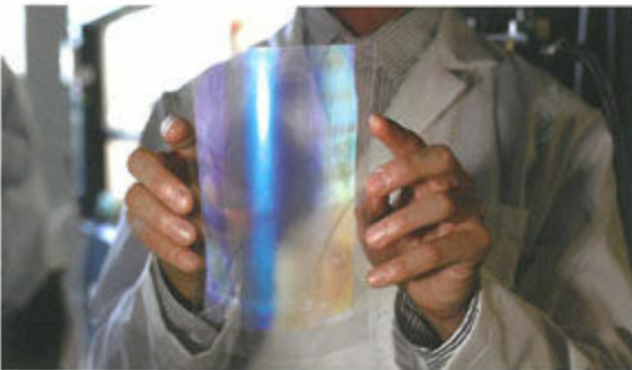
'Block copolymer,' produced by Hiroaki Sai and Ferdinand Kohle from the Wiesner Group, refracting various wavelengths of light dependent on the angle from which it is viewed.

profound consistency between nano-scientific phenomena and her artistic practice allows her to work within an invisible realm outside the register of human senses and to bring reality closer to our own experience — a practice to which she has always been committed.