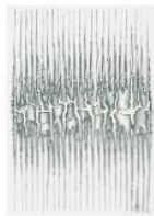
무제, 1984 한지에 과슈, 먹 165×116 cm