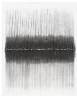
무제, 2015 한지에 과슈, 먹 162×130 cm