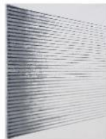
무제, 1987 한지에 과슈, 먹 224×170 cm

URL: http://www.dodooba.com/guide_details.php?ref_id=2487&feature_type=0