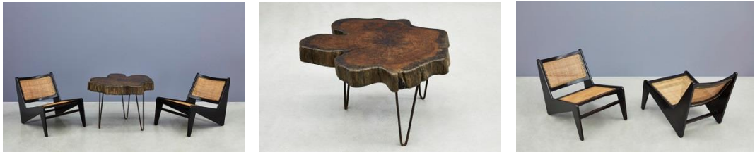
“통나무” 커피테이블(“Tree Trunk” Coffee Table)과 “캥거루”의자(“Kangaroo” Chairs)

위 이미지: 인도 찬디가르에서 르 코르뷔지에와 피에르 잔느레