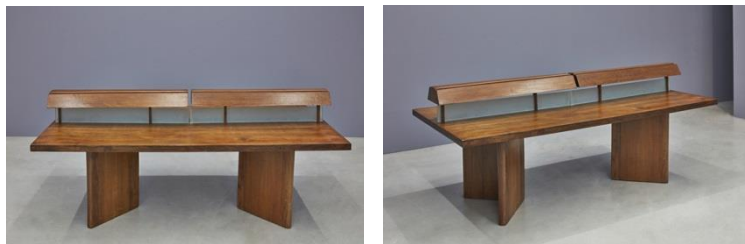
도서관 책상(Library Table), ca. 1960, 108(H)x243.8(L)x121(D)cm