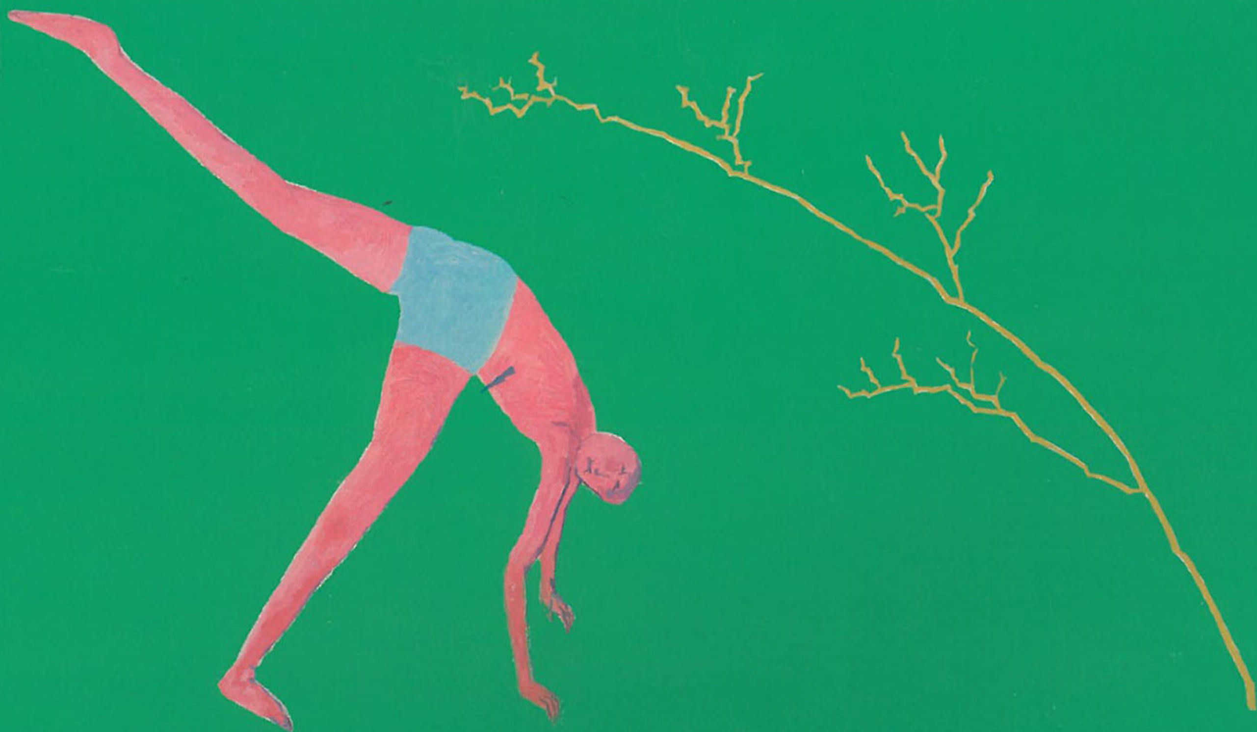
王萬春 鞠躬 壓克力顏料、畫布 100 × 80 cm (局部)

亞洲之星/李岫 最佳策展人/片岡真實 最佳展覽/尤倫斯當代藝術中心 戴漢志：5000個名字 最佳策展團隊/上海當代藝術博物館 最活躍藝術家/徐震 最佳藝術家個展/台北市立美術館 徐冰 回顧展 最佳藝術經理人/許宇 最佳畫廊/白立方畫廊 明日之星/孫遜 漲幅最大的藝術家/王光樂 最佳畫冊/江賢二 台灣遠見天下文化