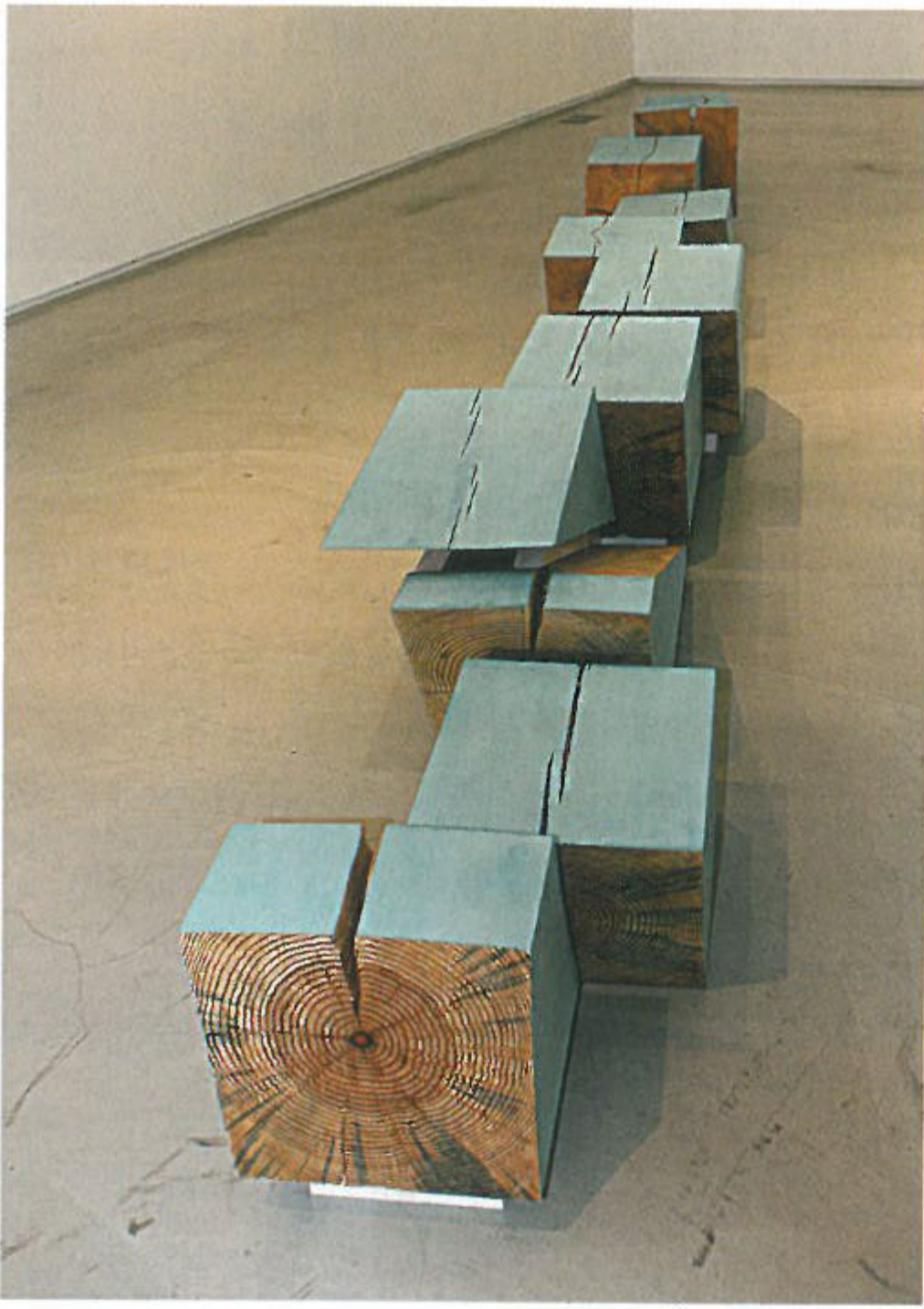
〈모든 단층들〉 목재에 채색, 린시드유 30×500×31cm 2014 아래 · 〈자기장〉 종이, 페인트, 풀 50×32cm 2014

이전 페이지 왼쪽 · 〈지구 중심으로의 여행 - 관통할 수 있는〉 가죽, 부석, 도금된 돌, 구운 세라믹, 유리, 화산석 300×300×400cm 2014_국제갤러리 전시 전경 오른쪽 · 국내 첫 개인전을 기해 한국을 찾은 다미안 오르테가.