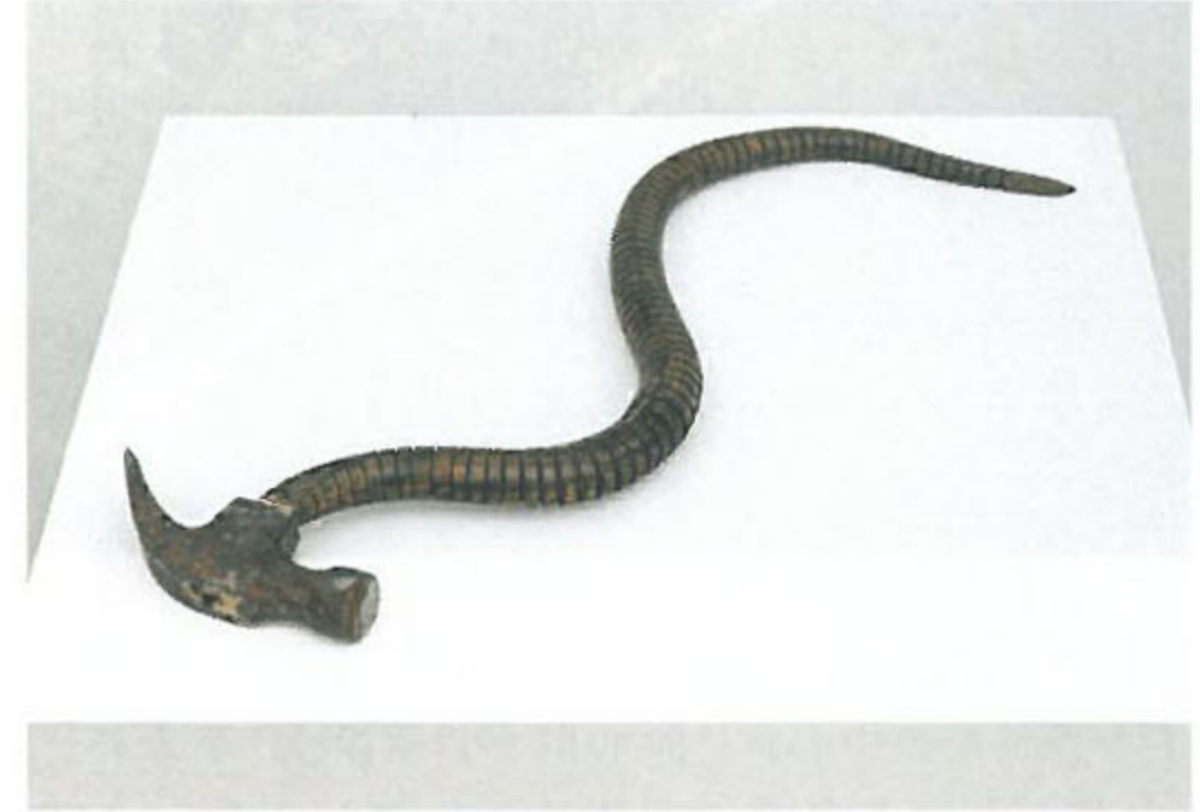
왼쪽부터 시계방향 <조각난 역사의 제스처> 혼합재료 2013_ 런던 프로이드뮤지엄 <Apestraction>전 전경 <요소 개념 모음집> 혼합재료 2013 <피곤한 곡괭이> 나무, 금속, 가죽 40.6×50.8cm 1997 <시간의 간략한 개요> 유리, 부석, 표주박, 계란 껍질, 콘크리트 22.5×22.5cm 2014