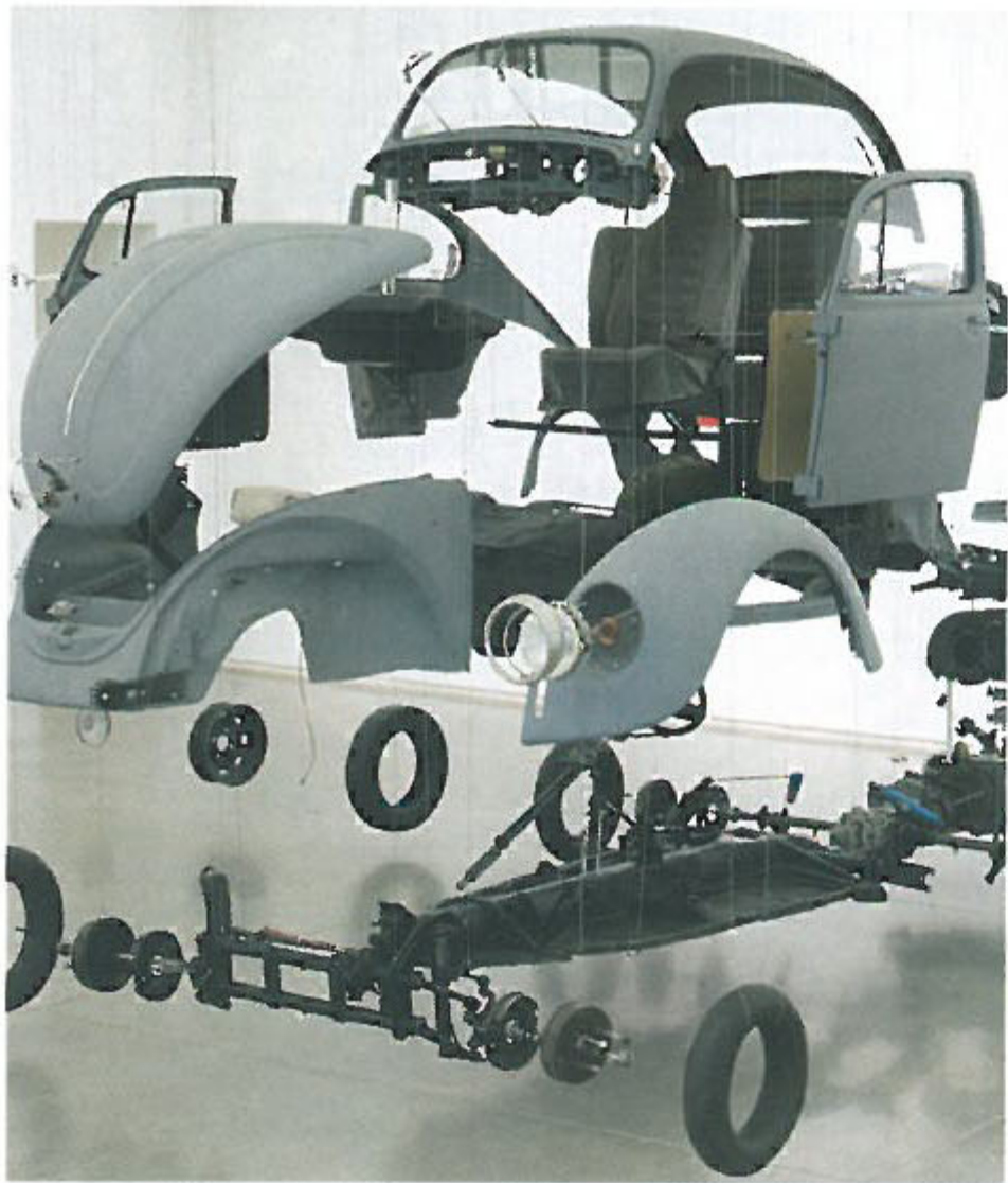
〈우주의 물건〉· 해체된 1989년식 폭스바겐 673.1×701×751.8cm 2002 LA현대미술관 컬렉션 작가는 이 작품으로 세계적 명성을 얻었다. 사상 첫 판매한 작품이기도 하다.