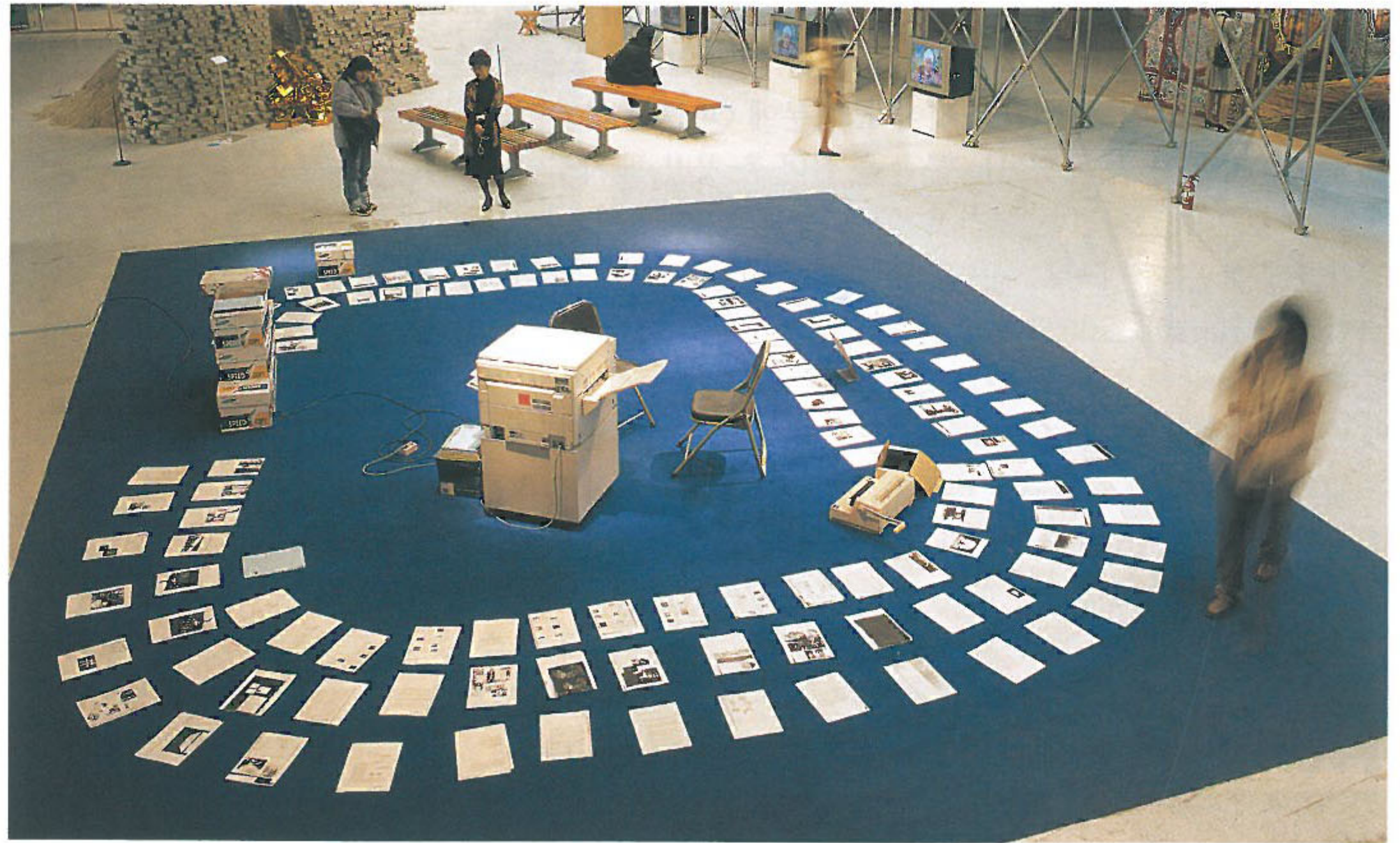
쿠리 만추토 〈즐거운 자본주의〉 복사기, 카펫 가변크기 2002_광주비엔날레 전시 전경. 오르테가가 몸 담았던 멕시코 대안그룹의 설치 퍼포먼스.

땅 밖으로 튀어나오도록 했는데, 그 모습은 마치 뒤집어진 보초의 무덤 같았다. 이 프로젝트는 그로부터 3년 후 보다 온전한 모습으로 완성되었는데, 이때 그는 한때 비틀을 생산했던 멕시코의 공장에서 가까운 땅 속에 실제 차 한 대를 통째로 묻었다. 이로써 탄생(〈우주의 물건〉의 빅뱅)부터 장례식(2005년작 〈비틀(Beetle)〉)까지 비틀의 인생을 다룬 3부작 시리즈가 완성되었다. 하지만 멕시코에서는 죽은 것도 살아난다. 2006년 그의 보초는 크롬 뼈대만 남은 〈유령(A Ghost)〉으로 다시 부활했다.