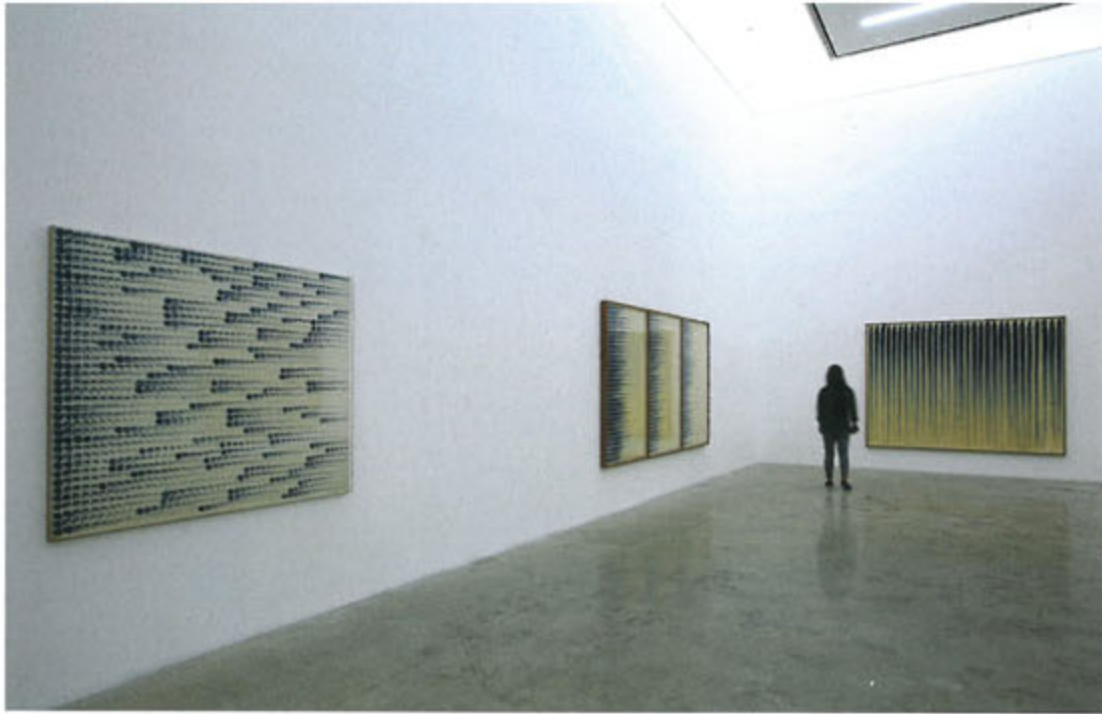
국제갤러리 <단색화의 예술전> 전시관경 위 · 이우환 <점으로부터>(사진 맨 왼쪽) 캔버스에 유채 128.5×161.8cm 1974 아래 · 박서보 <묘법 No. 10-72>(사진 맨 왼쪽) 캔버스에 유채와 연필 194.5×260cm 1972