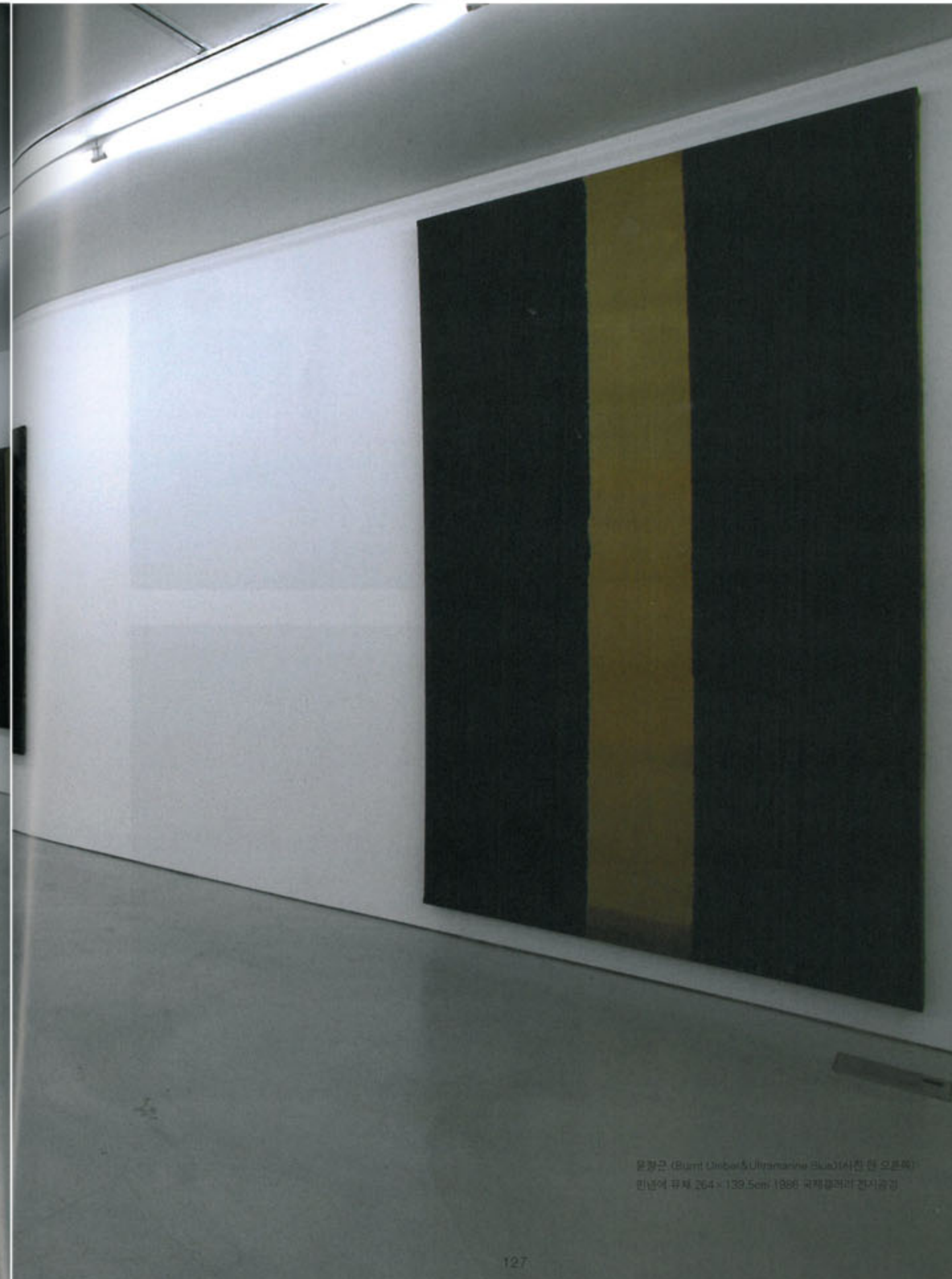
문장근 (Burnt Umber & Ultramarine Blue) 서간은 오존색 민남에 유채, 264 x 139.5cm, 1986 국제갤러리 전시공간