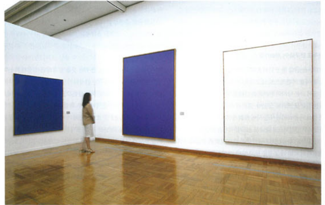
우암미술관 <고요한 물림전> 전시관경 위 · 정상화 <무제 80-9-23>(사진 맨 오른쪽) 캔버스에 아크릴 226×181cm 1980 아래 · 하종현 <집합 06-010>(사진 맨 왼쪽) 마포천에 유채 194.5×269.5cm 2006