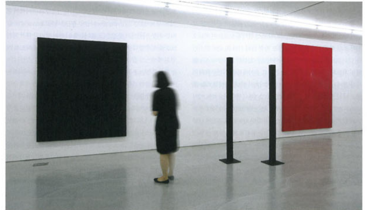
김기린 <Visible, Invisible>(사진 맨 왼쪽, 1977) <Inside, Outside>(가운데 설치, 1980년대)

하지만 1970년대의 단색화 작업이 "물상화되고 소외된 닫혀진 자기완결 세계"에 대한 비판(이우환)에 기초해 장소의 열림을 지향하는 것으로 시작되었다는 것 역시 사실이다. "자기의 대상성을 투명하게 하는 존재"(이우환)의 등장은 그것이 처음 등장한 시점에는 모든 이데올로기를 거짓된 것으로 부정하는 비판의 정신을 지니고 있었다고 할 수 있다. 하지만 그렇게 모든 것을 지워버린 깨끗한 텅 빈 화면은 곧 갖가지 욕망(그 가운데는 화가 자신의 세속적 욕망이 포함될 것이다)이 투사되는 스크린이 되었고 욕망들은 그 깨끗한 것을 오염시켰다. 그런 의미에서 1970~80년대의 단색화는 사회적으로 역설적이다. 어쩌면 단색화의 사회적 의의란 그 역설을 우리 앞에 생각할 거리로 던져주었다는 점에 있다고 해야 할지도 모르겠다. ●