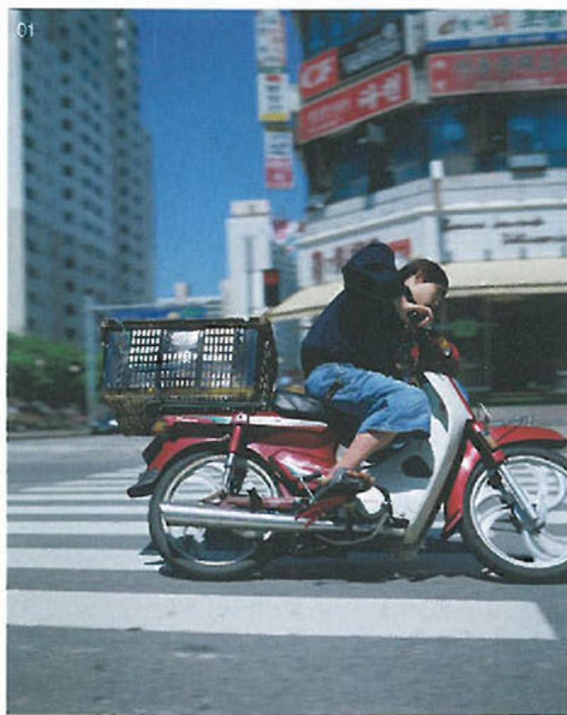
01 영웅, C-print, 135×180.7cm, 1998 02 상록타워, 32 Photographs, 80×55cm, 2001 03 크레용팝 스페셜, Media Installation with Performance and Sound, 2014