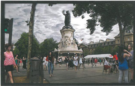
d'ici et d'ailleurs - Guy, 2015 © 정연두