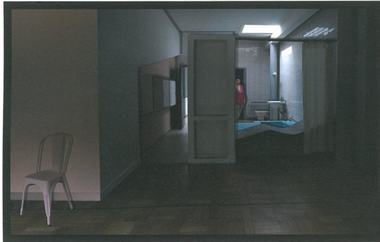
d'ici et d'ailleurs - HABIBA, 2015 © 정연두