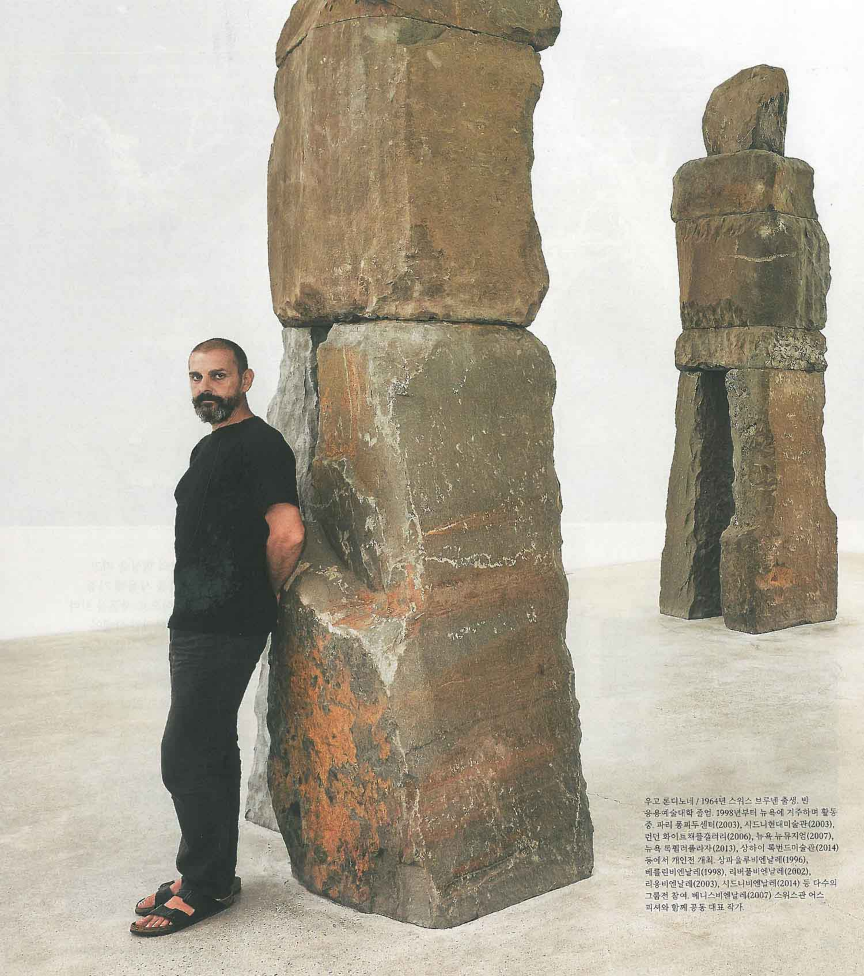
우고 룬디노네 / 1964년 스위스 브루넬 출생. 빈 응용예술대학 졸업. 1998년부터 뉴욕에 거주하며 활동 중. 파리 퐁피두센터(2003), 시드니현대미술관(2003), 런던 화이트채플갤러리(2006), 뉴욕 뉴뮤지엄(2007), 뉴욕 록펠러플라자(2013), 상하이 록번드미술관(2014) 등에서 개인전 개최. 상파울루비엔날레(1996), 베를린비엔날레(1998), 리버풀비엔날레(2002), 리옹비엔날레(2003), 시드니비엔날레(2014) 등 다수의 그룹전 참여. 베니스비엔날레(2007) 스위스관 어스 피셔와 함께 공동 대표 작가.